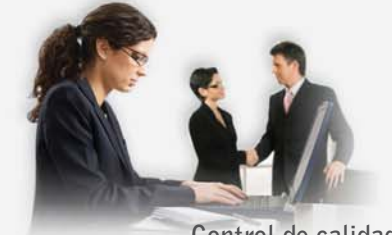
Control de calidad